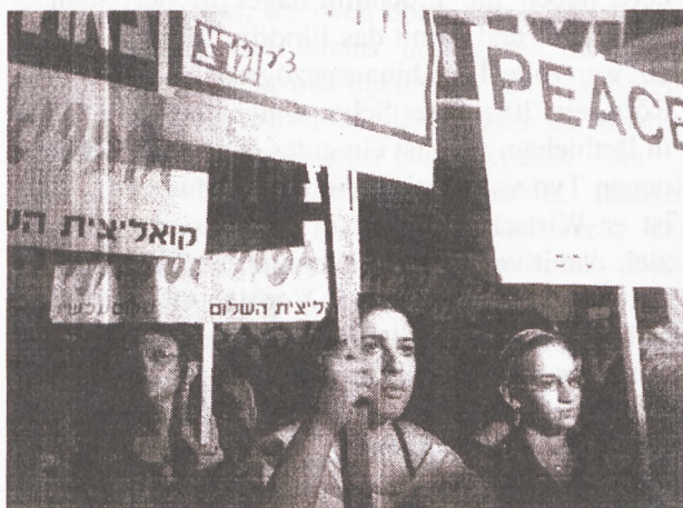
Friedensdemo in Tel Aviv

zusammen. Er erzählt über die Situation in Israel. Die Lage ist sehr schlecht, nicht nur deswegen, weil in jedem Krieg der erste Reflex der Schulter-schluss ist; nicht nur deswegen, weil den Israelis wegen der Selbstzensur der Presse ein völlig verstelltes Bild von der Realität vermittelt wird: Sie bekommen lange Reportagen über die Beerdigung der Opfer der Selbstmordattentate und über deren Angehörige zu sehen; aber nur kurze Bilder über die Lage im Westjordanland, die zudem den Eindruck erwecken, die Lage würde sich dort normalisieren.