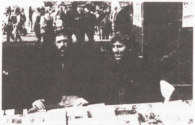
AFB in Recklinghausen

Zum zweiten mal fand daneben eine alternative Mai-Demonstration mit ca. 200 TeilnehmerInnen statt, organisiert von Vertretern von Einzelgewerkschaften, unterstützt von PDS, DKP und MLPD. Der DGB hatte zum zweiten Mal keine Demonstration, sondern nur eine Kundgebung auf dem Hügel ange-