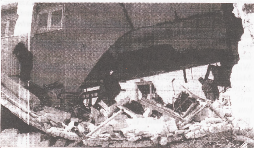
Nablus, 3. Mai 2002

„Daß kein westeuropäisches Land imstande gewesen ist, die Verteidigung der elementaren Rechte des jüdischen Volkes zu gewährleisten oder es vor den Gewaltakten der faschistischen Henker zu schützen - das erklärt das Verlangen der Juden, ihren eigenen Staat zu gründen. Man kann dieses Recht dem jüdischen Volk nicht verweigern, wenn man alles berücksichtigt, was es im Verlauf des zweiten Weltkrieges erlitten hat. ... Weder die Vorgeschichte noch die heutigen Verhältnisse in Palästina können eine einseitige Lösung der palästinensischen Frage rechtfertigen, sei es im Sinne der Gründung eines unabhängigen arabischen Staates, ohne die legitimen Rechte des jüdischen Volkes zu berücksichtigen, sei es im Sinne der Grün-