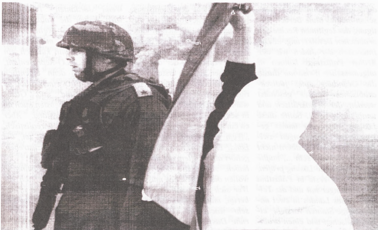
Bethlehem am 1. Mai 2002