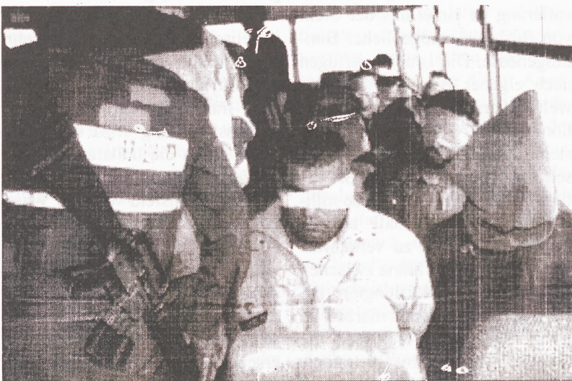
Palästinensische Gefangene aus Fatah Hanun

In seiner State-of-the-Union-Rede vom 29. Januar 2002 hat Bush herausgestrichen, dass er