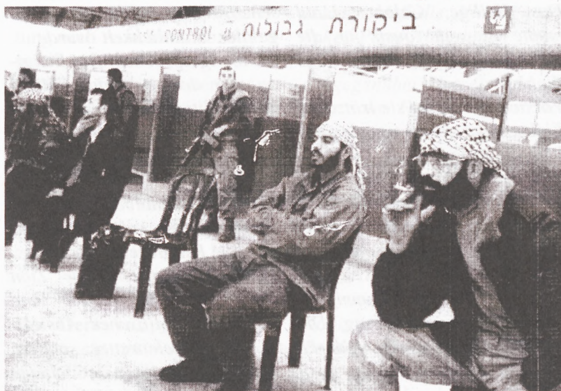
Flughafen Tel Aviv: Vor der Abschiebung

anismus gegenüber dem Judentum zu, dem er mit seiner Vernichtungsstrategie unbeabsichtigt sogar erst zur Nationwerdung verholfen hat; letzteres trifft aber auch auf den Zionismus zu, der dem palästinensischen Volk die eigene Identität verweigert und ihm damit - ebenfalls unbeabsichtigt - zur Nationwerdung verholfen hat. Und dies praktisch seit seinem Bestehen, d.h. seit Ende des 19. Jahrhunderts, als die ersten zionistischen Siedlungen - auch gegen den Widerstand der bis dahin in Palästina ansässigen jüdischen Bevölkerung - errichtet wurden. Ja das zionistische Streben nach einem jüdischen Staat wurde lange Zeit von denjenigen Juden, die ihr Selbstverständnis religiös begründeten, als Gotteslästerung betrachtet, denn diese „Säkularisierung“ der biblischen