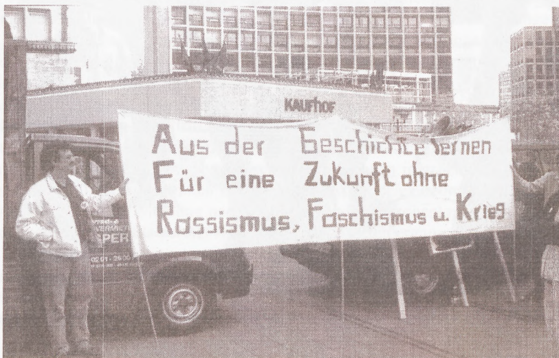
Auftakt am Willy-Brandt-Platz

Von der Ankündigung des geplanten Versuchs (Sprechchöre „Saalbau, Saalbau“) über die in pro-