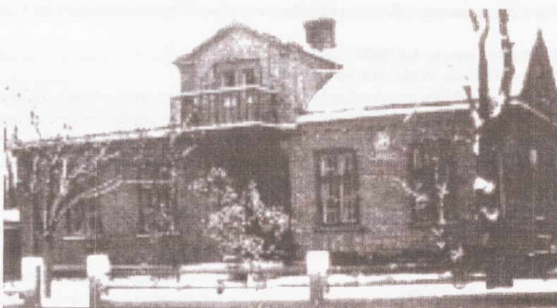
Unterkunft der Gestapo

Die von den Deportierten mitgeführten Wertgegenstände wurden nach Vernichtung ihrer Eigentümer sortiert und z.B. Bekleidung und Schuhwerk massenweise in vom Luftkrieg heimgesuchte deutsche Städte transportiert, um die dortige ausgebombte Bevölkerung damit zu versorgen. Das lief dann etwa über Organisationen wie die NSV