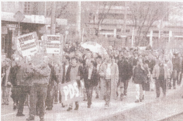
700 Menschen demonstrierten