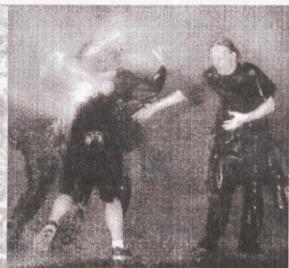
Kreuzberger Nächte: Polizei rüstet auf

Für den CDU-geführten Berliner Senat ging die Gefahr einzig von links aus. Die Grußadresse des Kanzlers an das multikulturelle Fest in Hellersdorf, in der er den Einsatz des Stadt-