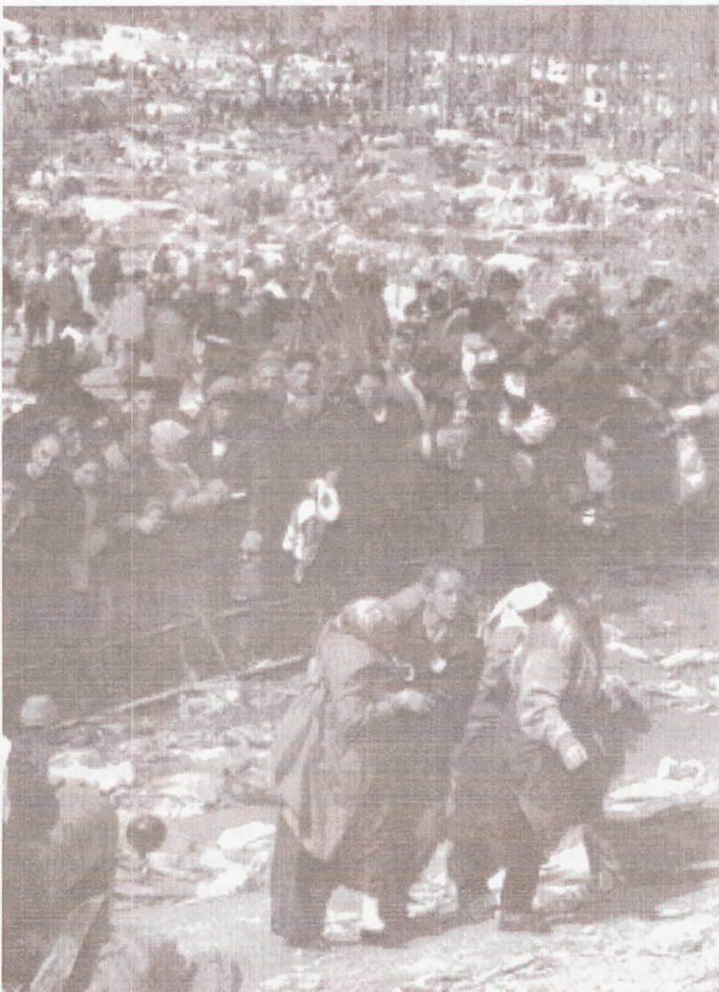
Vor einem Jahr: Flucht in Kosova

Der Alltag in Kosova ist schwarz-weiß. Die Kälte zog ein, auch unter den Albanern. Positionen locken. Die alte albanische Frau, die man mit durchgeschnittener Kehle am Waldrand in Drenica fand, wurde schnell vergessen. Wieder einmal leben die einfa-