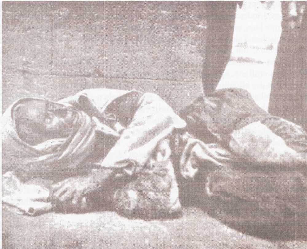
Flüchtende in Jerewan (1922)

Eine Parlamentsdebatte im deutschen Bundestag würde auch der Türkei signalisieren, dass ein weiteres Totschweigen des Völkermordes politisch nicht opportun ist. Denn seit die Türkei Beitrittskandidat zur EU ist, wird die Anerkennung des Völkermordes durch den Nachfolge-