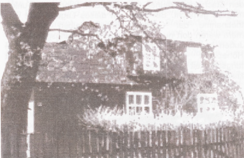
Villa der SS-Kommandantur

Im Herbst 1942 wurde ein Schaufelbagger eingesetzt,