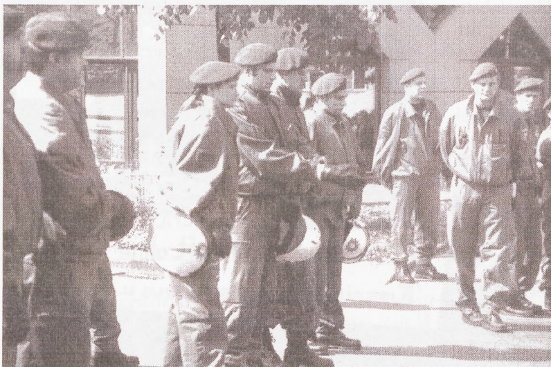
Gleich geht's los