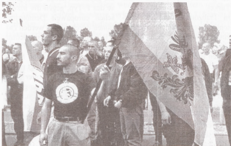
Nazis in Berlin-Hellersdorf

Das undemokratische Verhalten des DGB und das Verbot unseres Info-Standes hinderte hunderte von Teilnehmern nicht daran, sich an der Aktion „Rote Karte für Schröder“ zu beteiligen. Obwohl die Rednertribüne weiträumig abgesperrt war,