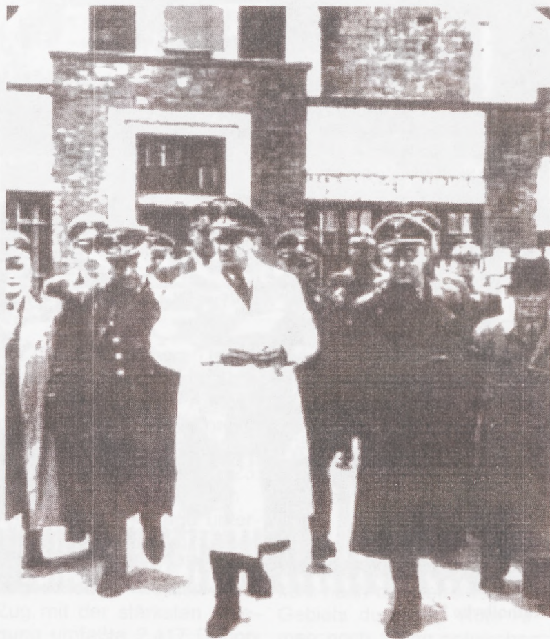
Himmler auf Inspektion in Izbica 1942

Bauer. Gelegentlich gelangten - durch Bestechung ukrainischer Wachleute - Kassiber aus Lager III in den übrigen Komplex, ansonsten aber war die Abschirmung fast perfekt. Wer zufällig Einblick in Lager III nahm, kam dort nicht mehr heraus. Trotzdem konnte die Funktion dieses Lagers nicht verborgen bleiben - der süßliche Verwesungsgeruch der Leichen verbreitete sich bei sonnigem Wetter meilenweit und war kaum erträglich. Das Feuer und den Rauch